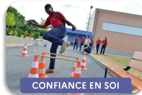
CONFIANCE EN SOI