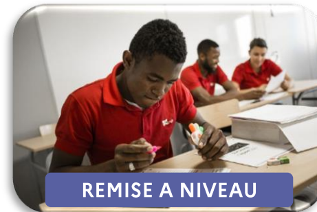
REMISE A NIVEAU